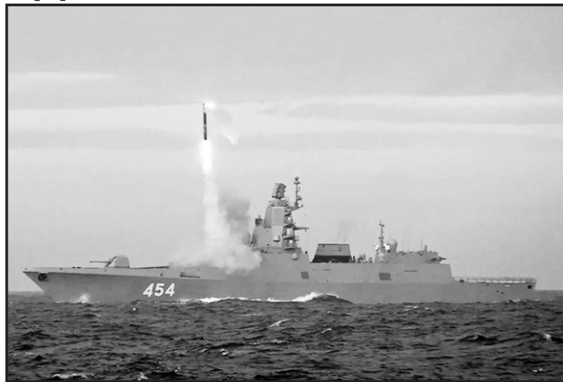
говорит. Со всеми вытекающими для ударного потенциала «Адмирала Горшкова» в Индийском океане последствиями.

В принципе их должно-то быть на орбите всего два. Наряду с пятью уже летающими ап- паратами пассивной радиотехнической разведки типа «Лотос», они, по идее, дали бы России воз- можность контролировать из космоса основные районы Мирового океана. Но первый и един- ственный пока «Пион-НКС» мы запустили в кос- мос лишь в июне 2021 года под обозначением «Космос-2550». Таким образом МКРЦ «Лиана» стала «одноглазой». Что для любой разведки – сами понимаете. А когда у морской космической разведки появляется второй глаз – никто пока и не